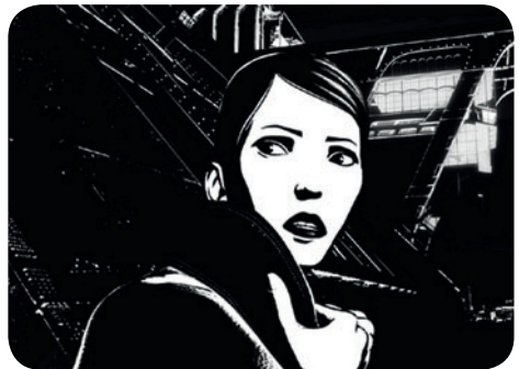
Renaissance / DR

Parc Montsouris (entrée à l'angle de la rue Nansouty et de l'avenue Reille) / RER Cité-Universitaire