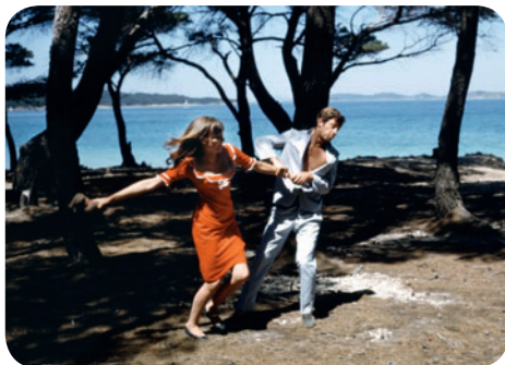
Pierrot le fou

Jardins du Trocadéro (face aux fontaines) / M° Trocadéro