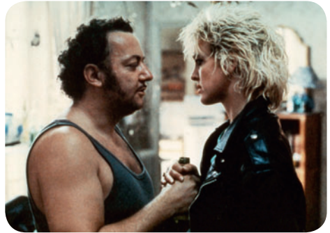
Tchao Pantin

Parc de Choisy (entrée principale avenue de Choisy) / M° Tolbiac ou Place d'Italie