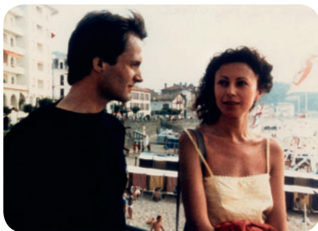
Le Rayon vert

Parc André Citroën (sur le parvis entre les deux grandes serres) / M° Balard