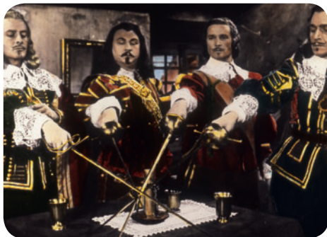
Les Trois Mousquetaires

Place des Vosges, square Louis XIII / M° Chemin-Vert ou Saint-Paul