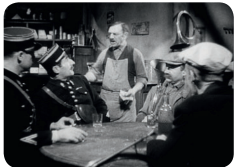
Goupi mains rouges

Terrain de Sport Ménilmontant (49, bd de Ménilmontant) / M° Père Lachaise