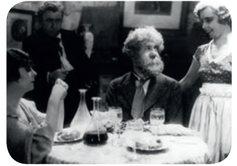
Boudu sauvé des eaux

Avenue de Breteuil, Place Henri-Queuille / M° Sèvres-Lecourbe